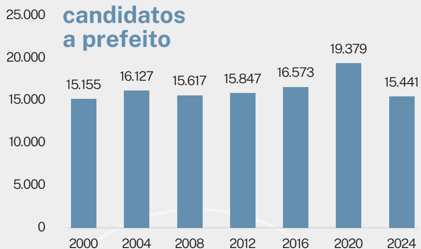
Figura 1 – Quantidade de candidatos a prefeito nas Eleições Municipais e candidaturas únicas: 2000-2024